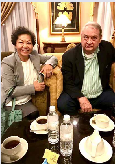
与诺贝尔奖得主Dr Ferid Murad合照