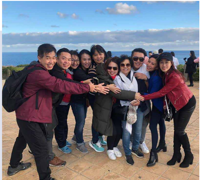
与创办人及上线共进晚餐