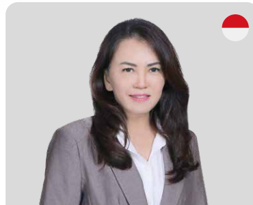
TO SIAUW JEN