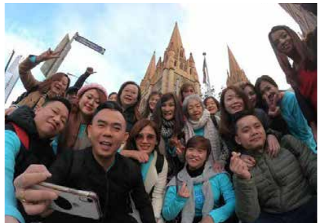
BE Lifestyle Travel 到澳洲墨尔本