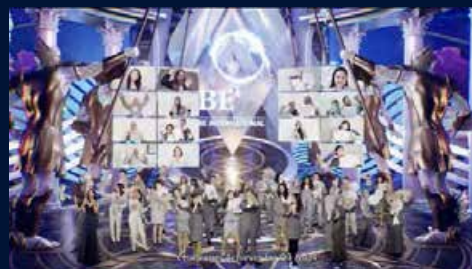
所有主讲者和合格者合影