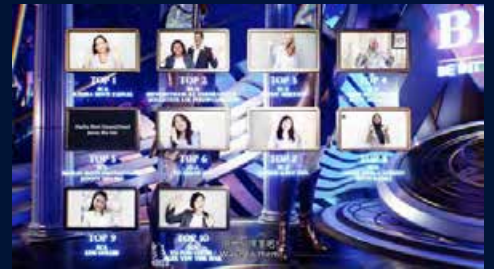
Top Sponsor Achiever Q3 & Q4