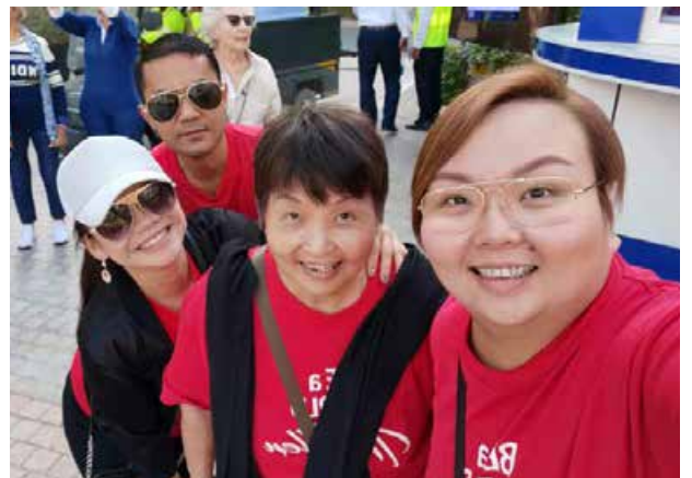
BE Lifestyle Travel 到韩国