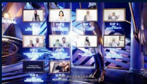
CCA Assemble Achiever Q3 & Q4