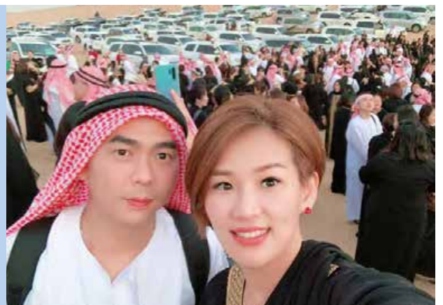
BE Lifestyle Travel 到迪拜

“我们的BE业务正开始蓬勃发展。可惜，我父亲来不及享受我们成功的果实。所以说，趁你还有时间去尽孝，赶紧抓住这大好机会，全力以赴，趁双亲还健在时与他们一起庆祝你的成功。别让人生留下遗憾。”