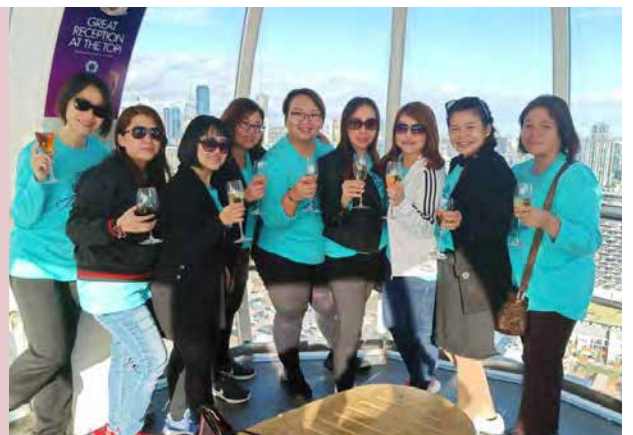
BE Lifestyle Travel 到澳洲墨尔本