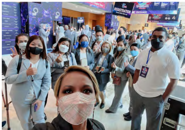
BE Convention 之夜