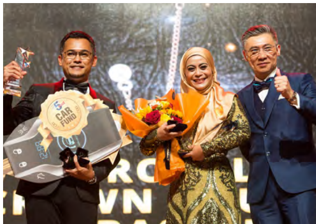
BE Convention 2022