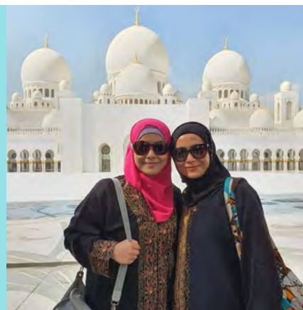
BE Lifestyle Travel 到迪拜

“要成为优秀的领导意味着我们要成为优秀的追随者。要学无止境，不断地挑战自己，勇敢走出舒适区做出改变。永远不要自满，永远不要安于现状，因为生活总是充满变化。”