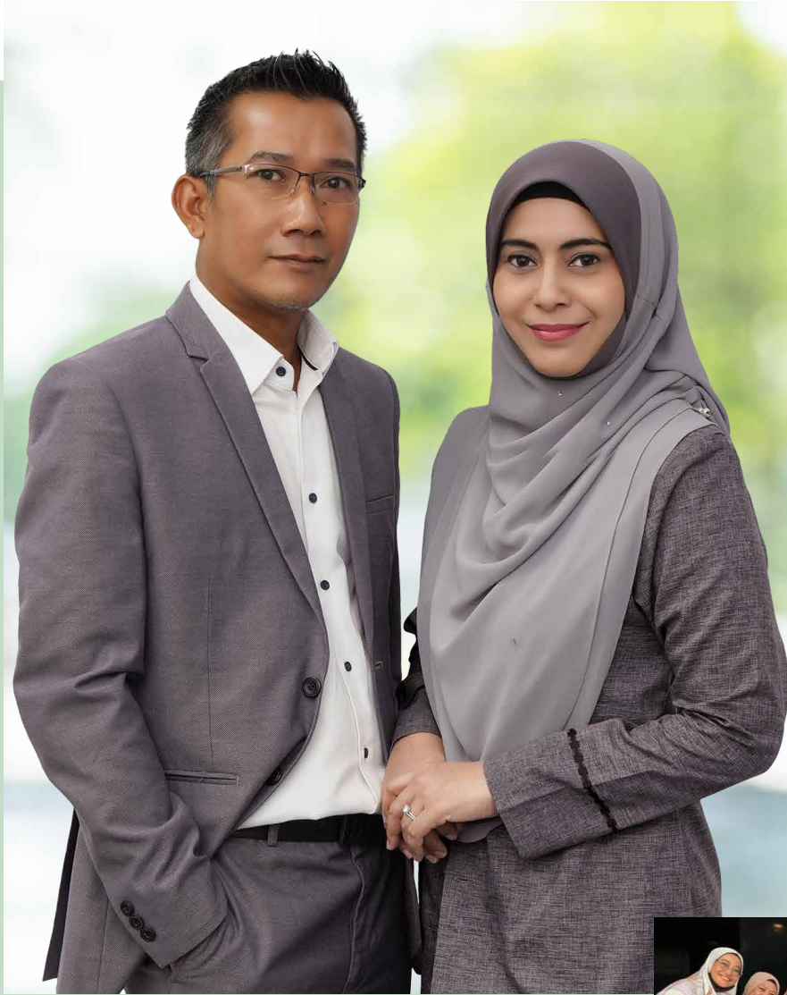
与公司创办人合照