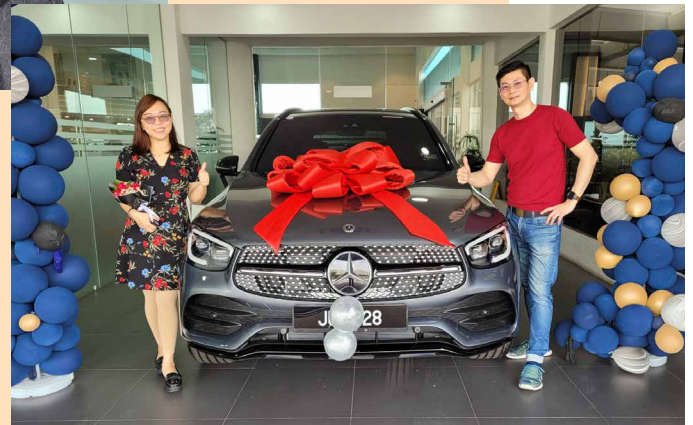
拥有梦想中的轿车

在亲身体验过出色的产品后，他们开始发展BE事业。只不过他们的BE事业并没有从此一飞冲天，